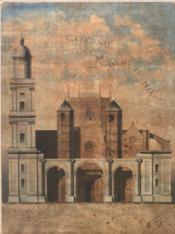
Construcción de la fachada neoclásica encima de la gótica.

No sería hasta finales del s. XIX, cuando Laureano Arroyo se encargaría de culminar el frontis con el templete central.