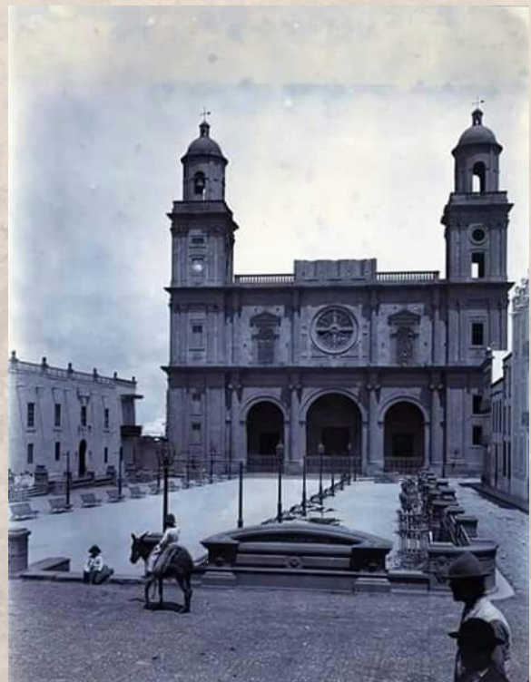
Fachada neoclásica sin el templete de Laureano Arroyo.