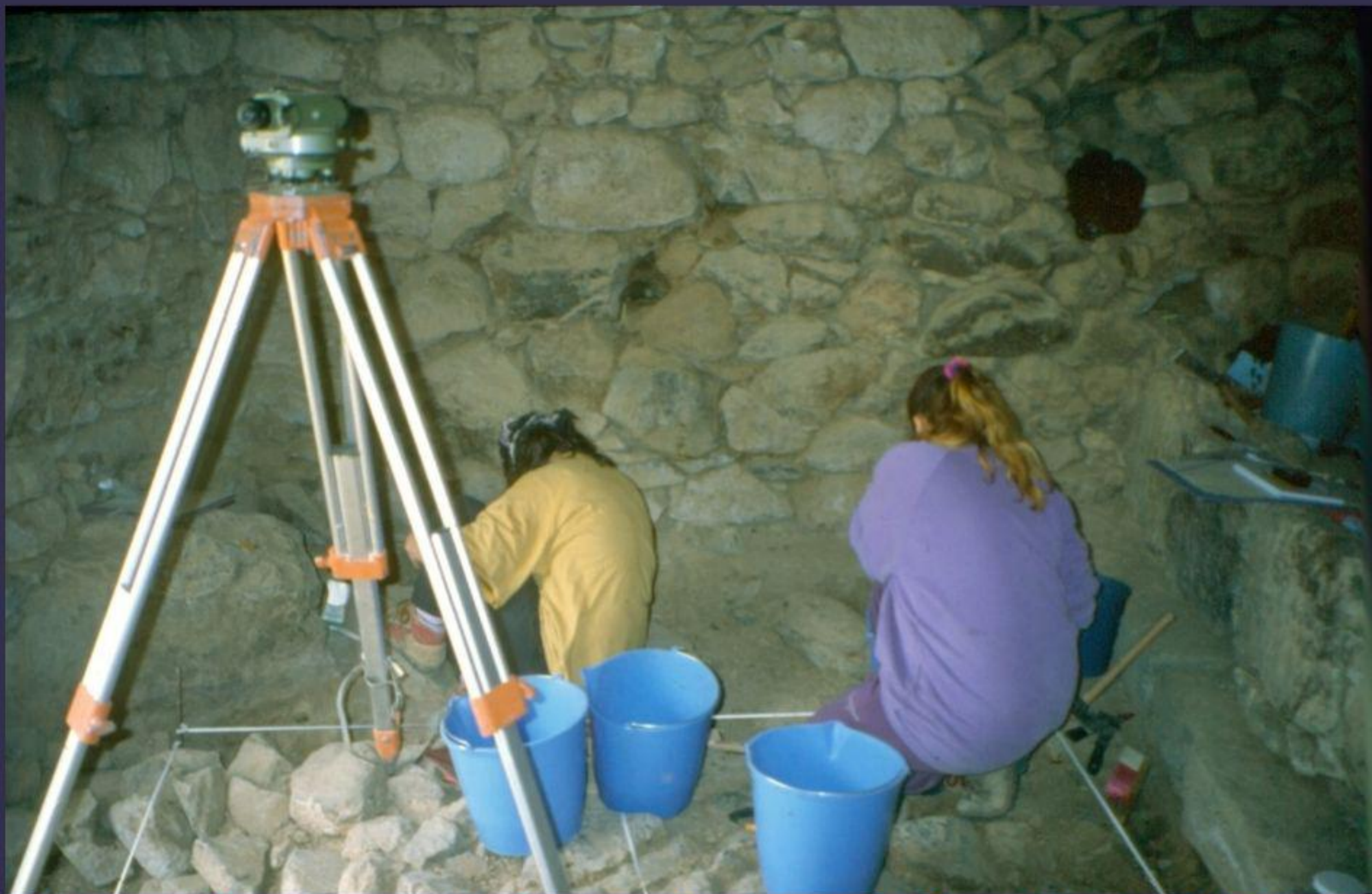
Intervenciones arqueológicas realizadas en la Casa Honda de Fataga